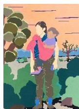
Il est où le bus