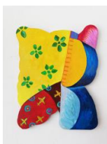
Peinture synchrétique n° 1 Un motif sans objet