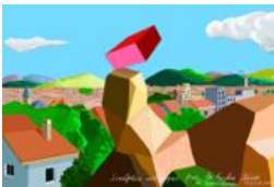
Sculpture utopique pour les Roches Noires à Saint Etienne, le 7 juillet 2010

Impression par sublimation sur polyester Édition limitée