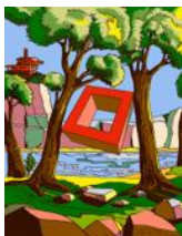
Un projet de Sculpture Utopique pour 2 pins au bord de l'eau. Décembre 2010

Impression par sublimation sur polyester Édition limitée