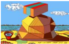
Projet une Sculpture Utopique sur la plage, 2010.

Impression par sublimation sur polyester Édition limitée