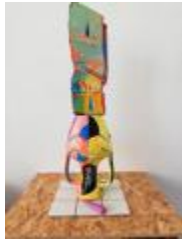
Mânes Pleurant n° 10

En quatre éléments. Bois de cyprès, terre cuite, céramique, béton, peinture acrylique