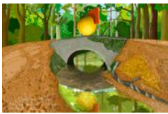
Sculpture Utopique pour un pont sur la "Rigole", Montagne Noire. Septembre 2010.

Impression par sublimation sur polyester Édition limitée