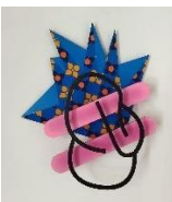
John Doe 2

Tissu imprimé, contreplaqué et encre acrylique