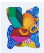
Peinture synchrétique n° 1 En préparation de la mer