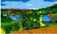
Sculpture Utopique à proximité du viaduc de Garabit. Aout 2010

Impression par sublimation sur polyester Édition limitée