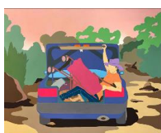
Le tout confort