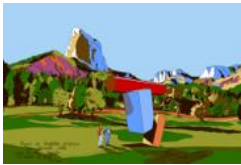
Projet de Sculpture Utopique, aux Grands Clôts sous le Mont Aiguille Saint-Michel-les Portes Octobre 2010

Impression par sublimation sur polyester Édition limitée