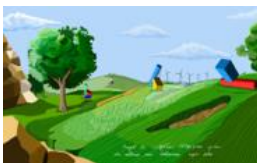
Projet de Sculptures Utopiques pour des collines aux éoliennes, septembre 2010

Impression par sublimation sur polyester Édition limitée