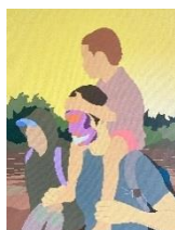
The water, dad and son