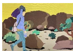
Ça va être long